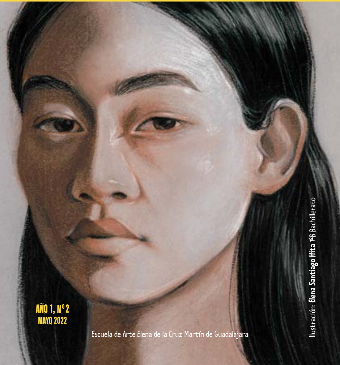
Ilustración: Elena Santiago Hita 1ºB Bachillerato