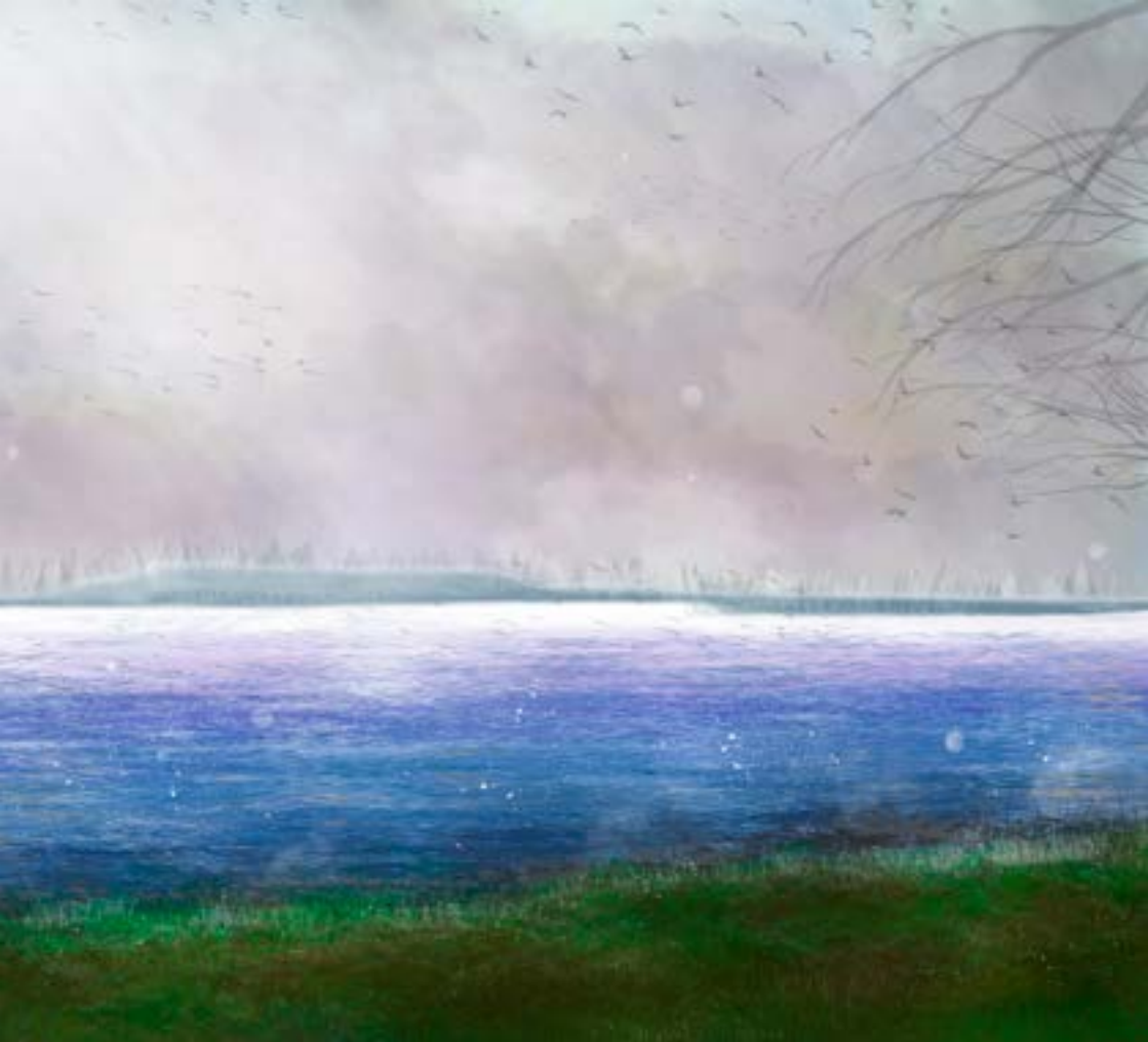
Ilustración digital Omar Belmehti Dos Santos